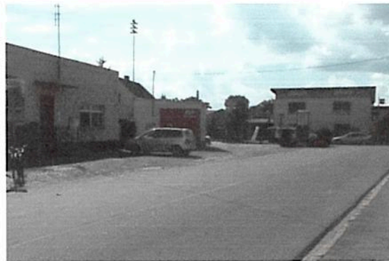
Główne skrzyżowanie w centrum wsi